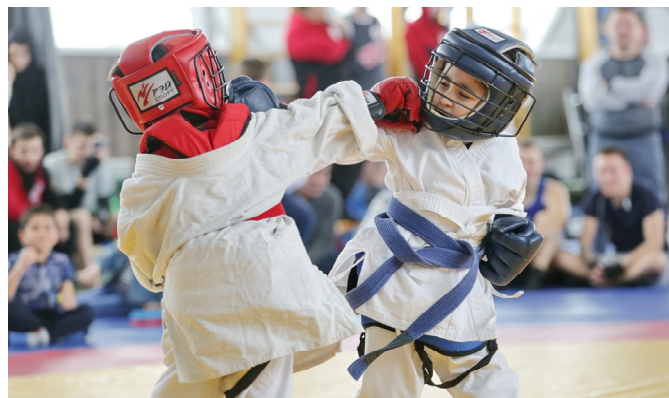
Самые юные участники турнира выступали в возрастной категории до 7 лет включительно

Планируется, что турнир по армейскому рукопашному бою в Тазовском будет проходить ежегодно и войдёт в календарный план Ямало-Ненецкой региональной физкультурно-спортивной общественной организации «Федерация армейского рукопашного боя».