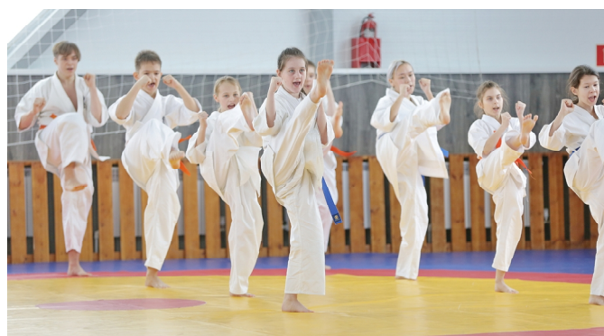
Мастер-класс от каратистов Тазовской детско-юношеской спортивной школы