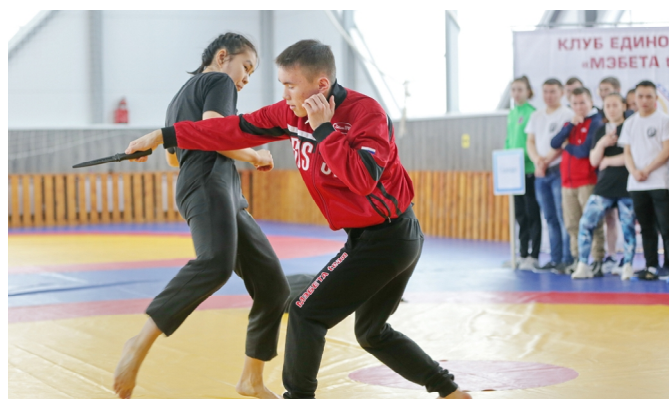
Показательные выступления воспитанников Клуба спортивных единоборств «Мэбета team»