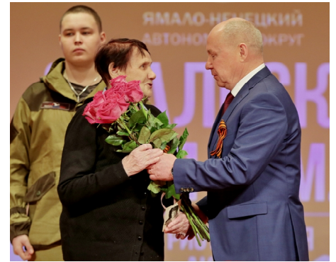
К сожалению, годы беспощадны к ветеранам ВОВ, их становится всё меньше, но те, кто жив, не обделены вниманием и заботой