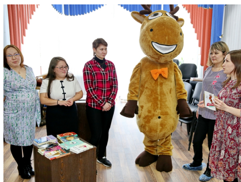
АННА ЛЮБИНА ФОТО ИЗ АРХИВА СЗ

Акция. В рамках реализации окружного проекта «Ямал читает» в Тазовском проходят встречи команды «Библиозорро» с трудовыми коллективами.