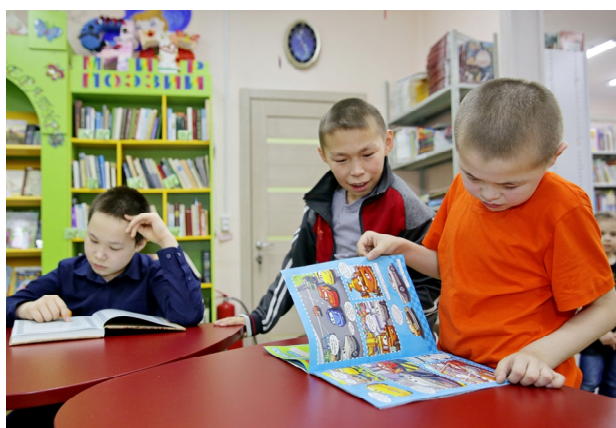
Периодические издания обновляются ежемесячно, многие развивающие журналы популярны среди школьников

гами и играми, в её фонде огромный выбор журналов. Периодические издания были и остаются оперативными источниками информации и не теряют своей актуальности.