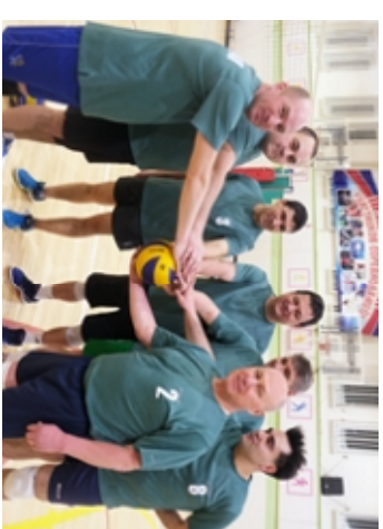
Матч между командами «Ветеран» и «Финалспас» закончился со счётом 2:0 в пользу лидеров этих соревнований