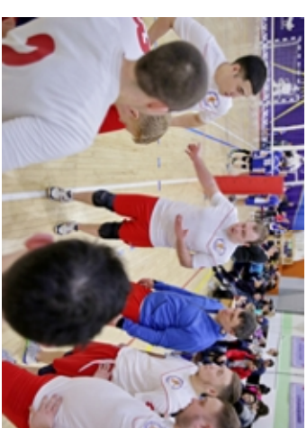
Участникам команды «Огнеборец» и «Спорттивная школа» предстояло сыграть три партии, встреча закончилась со счётом 2:1 в пользу «Спортшкола»

До закрытия спортивного сезона тазовчанам предстоит участвовать в соревнованиях семейных команд, дартер, баскетболе среди мужских команд и лыжных гонках. Причём лидере в баскетболе среди мужских команд будет определён уже на следующий ирок.