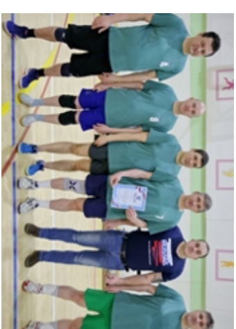
Победителем соревнований по волейболу среди мужчин стала команда «Ветеран»

□ ОСТАВЬТЕ КОММЕНТАРИЙ К ЭТОЙ ТЕМЕ НА НАШЕМ САЙТЕ WWW.SLAVYANSKOE ZAPOLYARIE.RU WWW.SLAVYANSKOE ZAPOLYARIE.RU