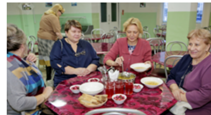
Заведующие детских садов Тазовского и Газ-Сале, чьи дети тоже ходят в школу, получили возможность оценить качество блюд