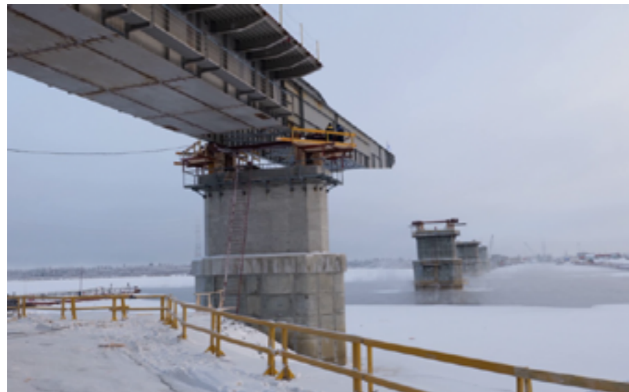
Строители обещают сдать мост через Пур уже осенью 2020 года