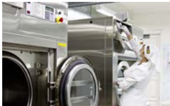
Оператор засыпает необходимое количество моющих средств и выставляет нужную программу