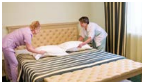
В гостинице «Метелица» представлены различные категории номеров - от эконом до люкса

сможет похвастаться ни одна хозяйка. Здесь с этим справляются специальные установки - гладильные каландры, предназначенные для одновременной сушки и глажения прямого белья. На мониторе выставляется температура и скорость прохождения в зависимости от типа ткани. Проходя через горячие валы, бельё не только разглаживается, но и обеззараживается высокой температурой. Также во время глажки операторы осматривают цельность ткани - порванное отбраковывают, и потом уже кастелянша, получив чистое бельё, сама решает, ремонтировать его или списывать.