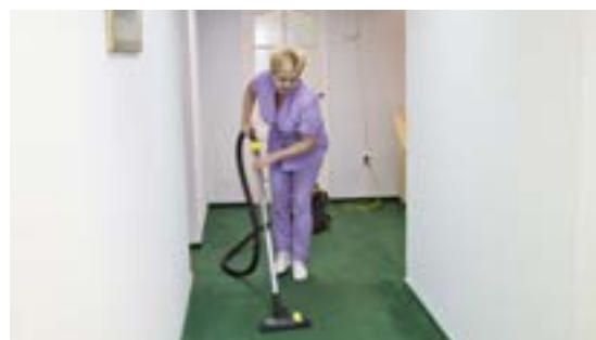
Горничные ежедневно поддерживают чистоту в гостинице