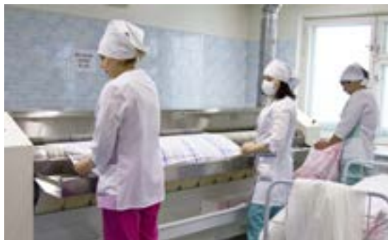
Гладильные каландры предназначены для одновременной сушки и глажения прямого белья