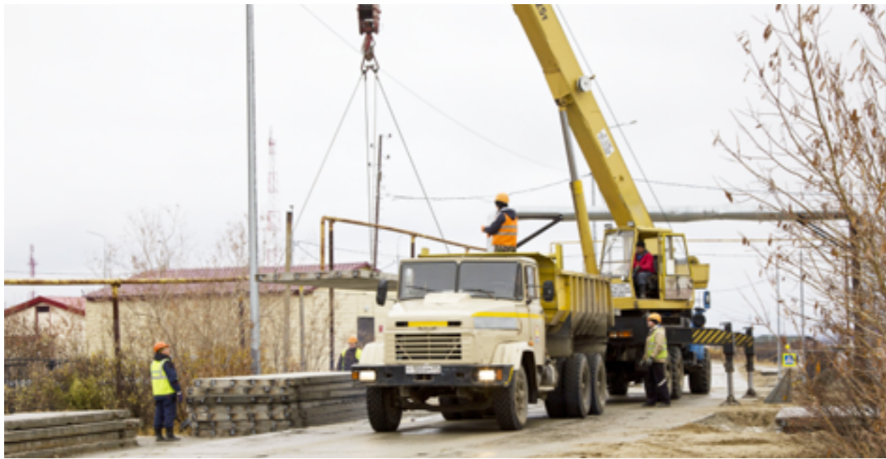
Ремонт участка на улице Русской (на фото слева) завершён на этой неделе. В эти же дни закончили менять плиты на улице 40 лет Победы (фото справа)