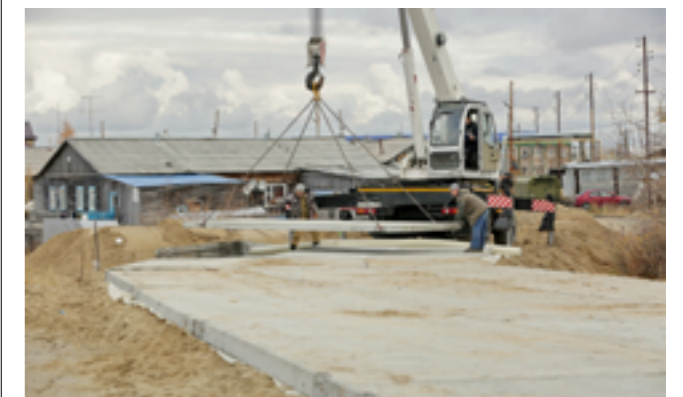
Стоимость ремонта дороги по улице Спортивной составила более 23 миллионов рублей

Как сообщает субординационная организация - ООО «Строительно-транспортная компания РИККА», все работы будут завершены ранее предполагаемого срока - к 15 октября, поэтому совсем скоро тазовские автолюбители смогут оценить обновлённую автодорогу в капитальном исполнении.