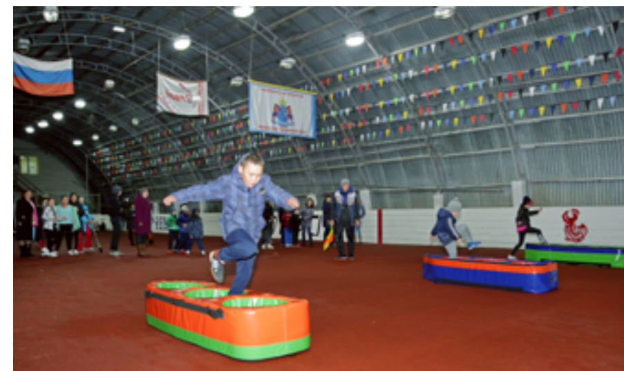
Полоса препятствий оказалась одним из самых сложных этапов эстафеты

День здоровья подарил детям настоящий спортивный праздник, который ещё долго будут вспоминать участники соревнований, а некоторые уже с нетерпением ждут новых состязаний, ведь это яркое событие в жизни детей с ограниченными возможностями здоровья позволило не только проявить свои спортивные умения, но и лучше познать себя и подружиться со сверстниками.