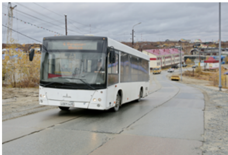
С 30 сентября в микрорайон Аэропорт будет закрыт проезд для всех видов транспорта - дорожники приступают к ремонту улицы Пристанской до дома № 41