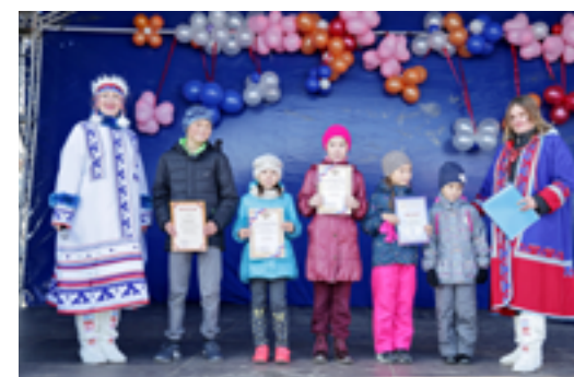
Ребятам, которые в прошлом году участвовали в выставках и конкурсах от Дома творчества, вручили дипломы

Как говорят воспитанники учреждения дополнительного образования, Тазовский районный Дом творчества - это целый мир, со своими буднями, праздниками, победами, конкурсами, отчётами. Здесь каждый ребёнок сможет найти занятие по душе, а мудрые и опытные педагоги с удовольствием помогут получить ценные знания.