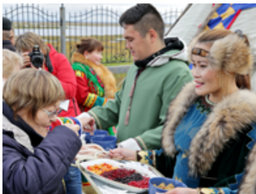
Участники семинара на себе почувствовали насколько гостеприимной может быть Тазовская земля: в первый день их угощали блюдами национальной кухни и знакомили с ненецкими обычаями

- На территории района хозяйственную деятельность осуществляют 12 общин коренных малочисленных народов Севера, из которых 11 заняты в рыболовстве, а 1 - в оленеводстве. Ежегодно общинники добывают более 150 тонн рыбы и заготавливают 70 тонн оленьины. Со стороны администрации района в целях поддержки