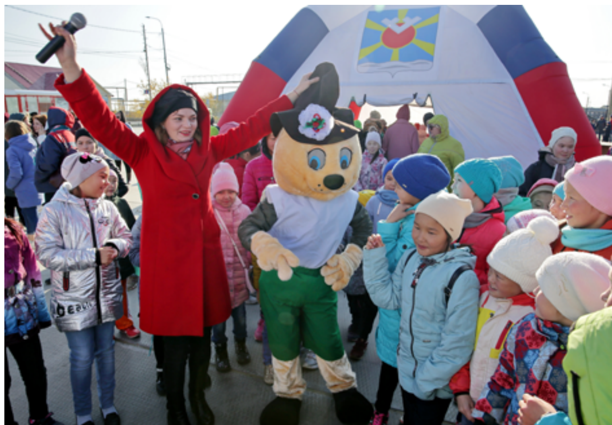
При помощи музыкальной шляпы дети узнавали мысли зайца

Праздник. Мелодичные песни, зажигательные танцы, музыкальные и спортивные конкурсы ожидали детей на центральной площади 22 сентября. Дом творчества провёл праздник «Осенний переполох»