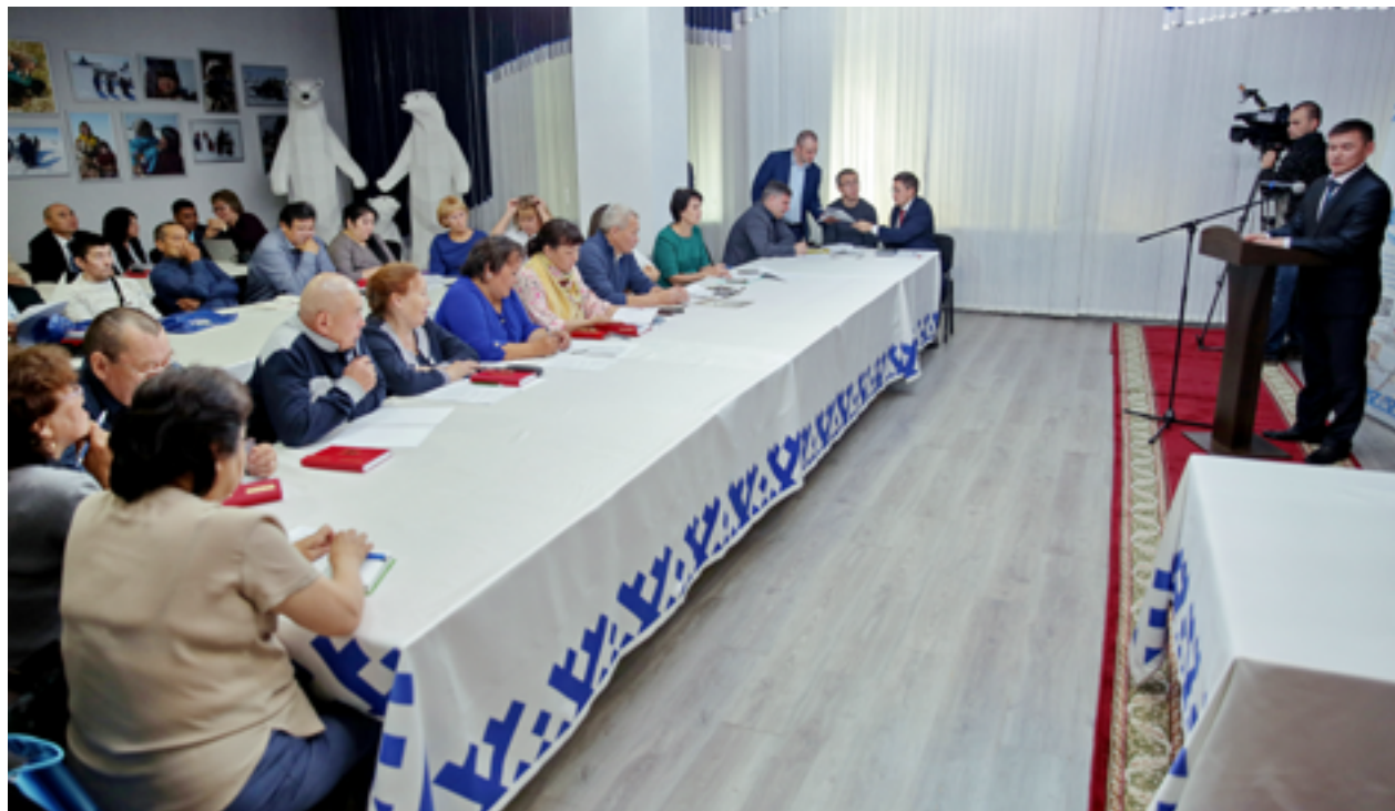
На семинаре рассмотрели перспективные направления деятельности общин, например, сбор дикоросов и этно-туризм