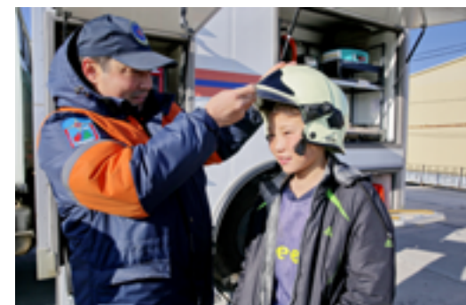
Подростки смогли примерить защитное снаряжение и почувствовать себя настоящими спасателями