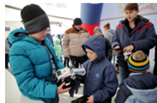
Управляемый робот привлёк внимание детей разных возрастов