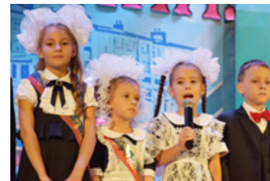
Обещание учиться на 4 и 5 дали все новички ТСШ