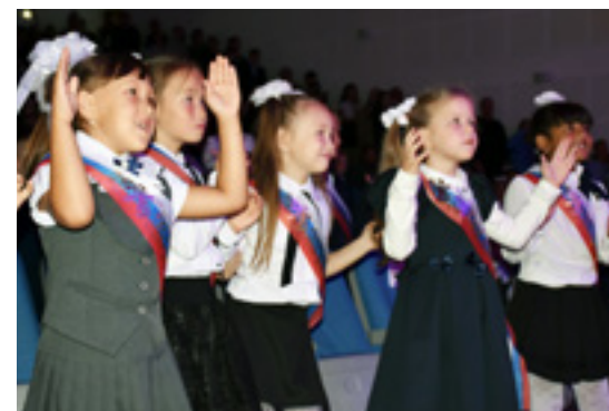
Свой первый танец в школе первоклассники станцевали в День знаний

БОЛЬШЕ ФОТОГРАФИЙ К ЭТОЙ ТЕМЕ НА НАШЕМ САЙТЕ WWW.SOVETSKOYE.ZAPOLYARIE.RF