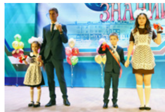
Первый звонок в Тазовской средней школе прозвучал в 55-й раз