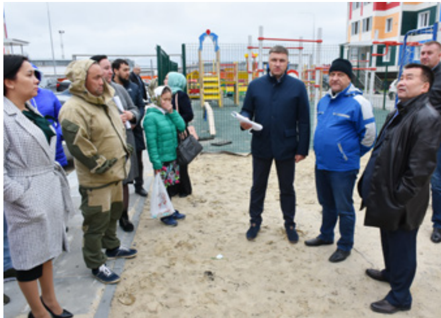
Для решения вопросов благоустройства придомовой территории тазовчане попросили содействия у районных властей

После физических соревнований жюри оценит творческие конкурсы: биваки, блюда, розжиг костра, упаковка рюкзака. В прошлый раз команды представляли свои творческие способности в разных жанрах. Сейчас организаторы ограничились одним видом - от участников требуется всем вместе исполнить оригинальную туристическую песню. Итоги по традиции будут подводиться отдельно по технике пешеходного туризма и конкурсной программе. Какие команды на этот раз станут самыми спортивными, быстрыми и оригинальными - узнаем в субботу.