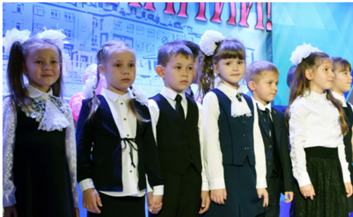
В этом учебном году в ТСШ сформировано 6 первых классов, в которых будут учиться 153 ученика