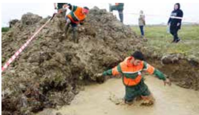
Любители адреналина преодолевали отвесные стены и барьеры, ползли по траншеям и ямам с грязью, спускались с крутых склонов и поднимались на вершины