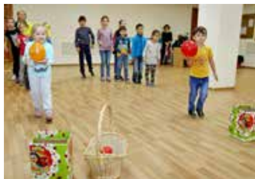
В увлекательном путешествии в Мир кино не обошлось и без спортивных конкурсов