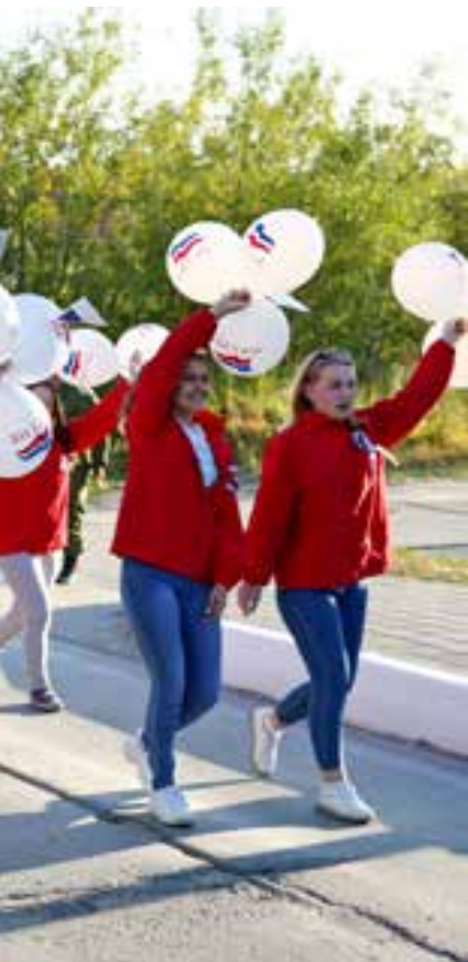
По улицам районного центра праздничной колонной прошли десятки тазовчан