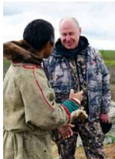
► МАТЕРИАЛ РАЗМЕЩЁН НА БЕЗВОЗМЕДНОЙ ОСНОВЕ, СОГЛАСНО ЗАО № 30 «О МУНИЦИПАЛЬНЫХ ВЫБОРАХ В ЯНАО»

экологии. Но надо отметить, что сегодня у предприятий ТЭК - совсем другая культура работы. Представители компаний встречаются с населением района и межселенных территорий, прислушиваются к их мнению, даже меняют маршруты газонефтепроводов, предусматривают переходы для оленьих стад. За счёт предприятий нефтегазового комплекса реализуется много проектов и в нашем муниципальном образовании, и в автономном округе, сегодня без них трудно развивать территорию. Главное, что есть понимание обеих сторон - необходимо соблюдать баланс между промышленным освоением и сохранением традиционного уклада жизни коренных северян и беречь экологию. Будем обязательно предпринимать меры по восполнению биоресурсов в Тазовском районе.