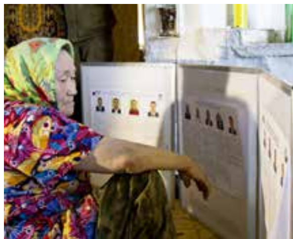
Стенд с информацией о кандидатах доступен каждому избирателю

- Кандидатов я знала, предпочтения были из-