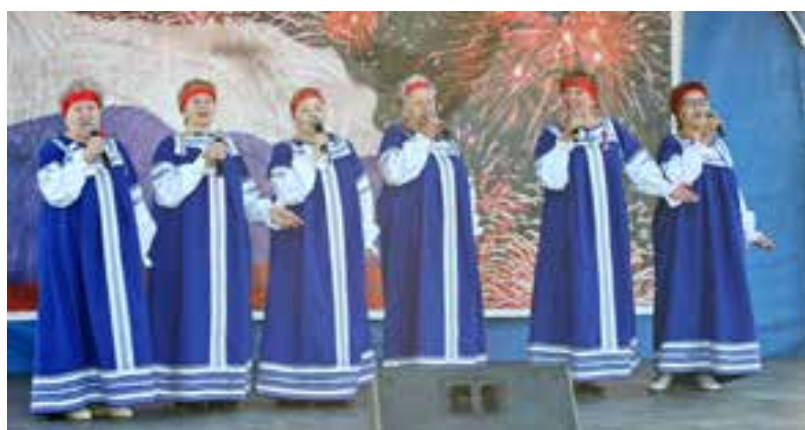
Яркие участницы праздничного концерта - ансамбль «Сударушки»

Праздничная программа, посвящённая Дню Государственного флага Российской Федерации, на центральной площади районного центра продолжалась несколько часов. Мероприятия в честь триколора прошли в этот день и в других поселениях муниципалитета. Так что Тазовский район провёл 22 августа под бело-сине-красным стягом.