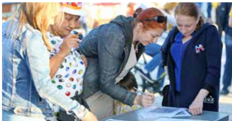
Тазовчане разгадывают кроссворд, вопросы которого посвящены символам России