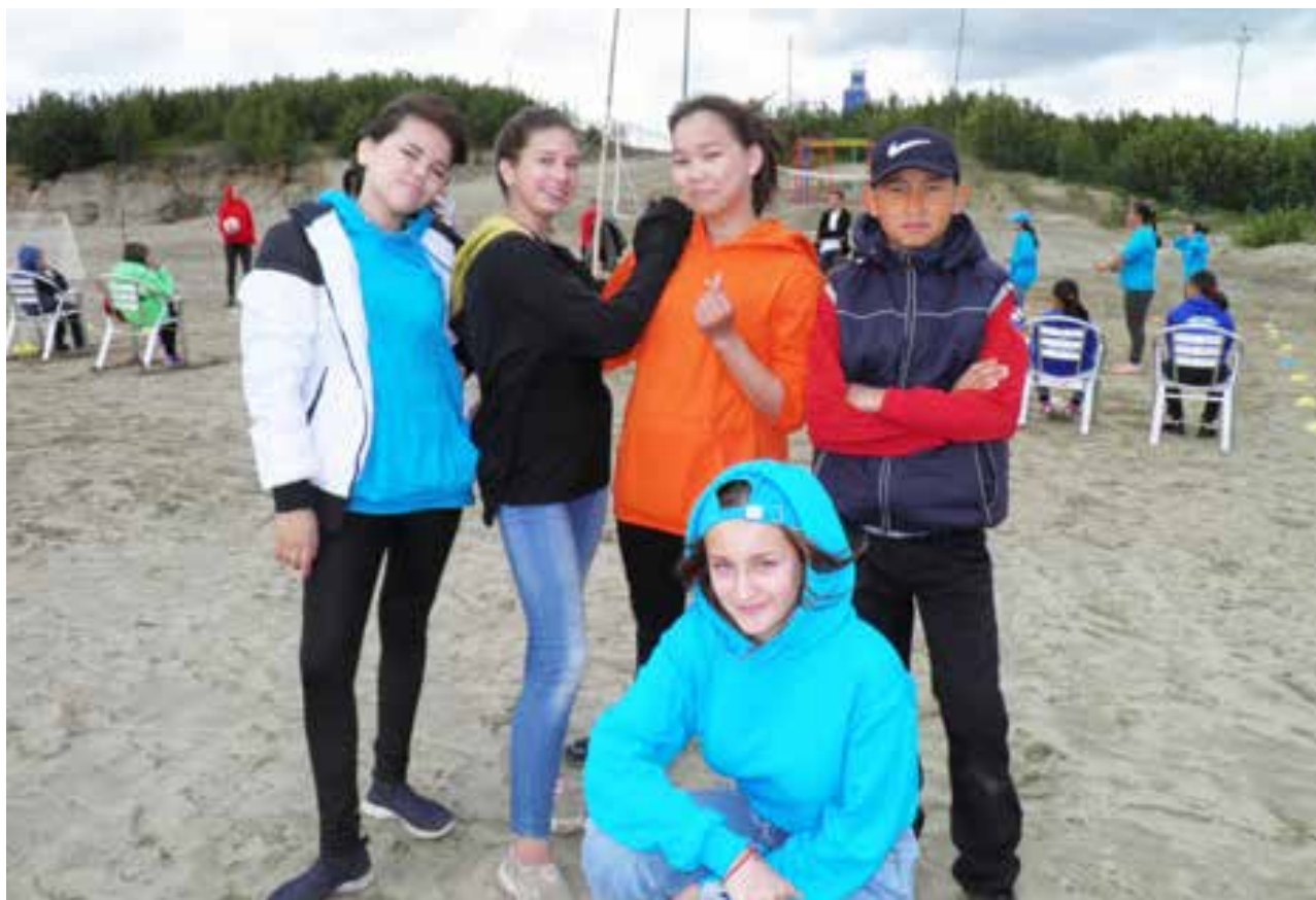
Отличное настроение - главная цель отдыха в лагере «Ясавэй»