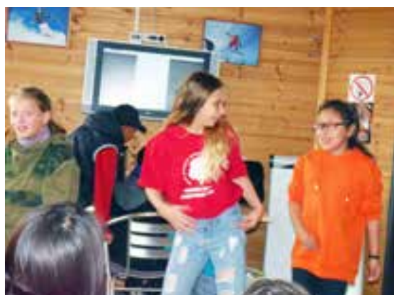
Возможно, в скором будущем ребята станут не дублёрами, а настоящими вожатыми, физруками и директорами родного лагеря