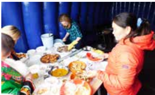
Горячий бульон, мясо и рыба оказались как нельзя кстати на свежем воздухе

Здесь же, в нескольких метрах от чума, палатка, в которой специалисты Управления по работе с населением межселенных территорий и традиционными отраслями хозяйствования администрации района организовали дегустацию национальных блюд. Всего понемногу, но в результате получается полная тарелка мяса и рыбы.