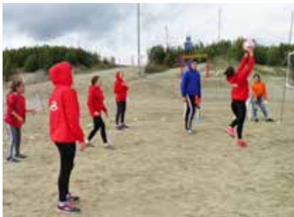
Как обычно до обеда лагерь играет в подвижные спортивные игры