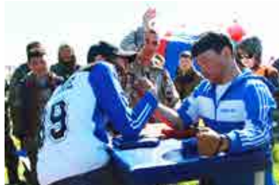
Спорт - самая зрелищная часть праздника