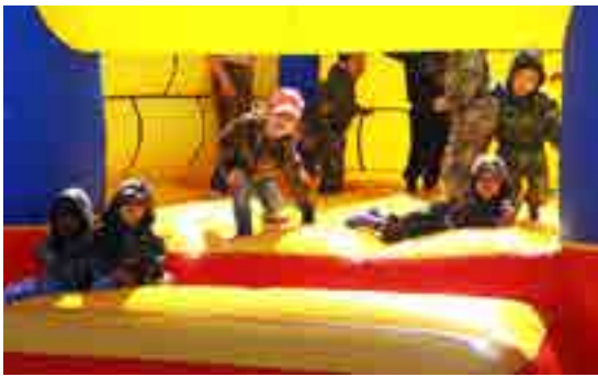
Надувной батут пользовался спросом у ребятни