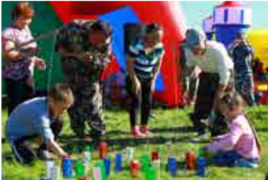
Необычные конкурсы для участников добавляли веселья