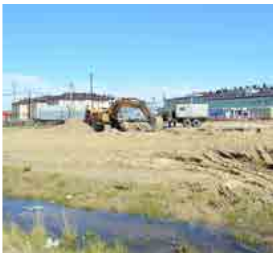
Уже че- рез два месяца на этом месте должен появиться новый открытый стадион

и баскетбол с травмобезопасным резиновым покрытием, площадки для подготовки и сдачи норм ГТО, место для прыжков в длину, площадки для игр, беговые и пешеходные дорожки. Работы начались 1 июня, а к 31 августа подрядчик должен сдать объект. Также в рамках программы «Комфортная городская среда» этим летом планируется благоустроить придомовую территорию около дома Геофизиков, 12а.