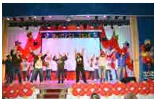
Родители смогли удивить детей своим выступлением