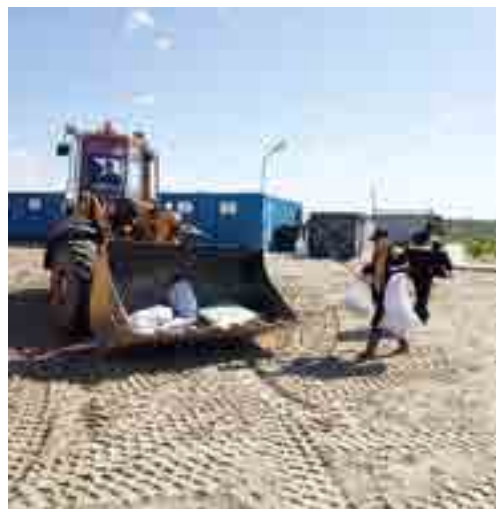
Уборка на Русском месторождении идёт полным ходом!