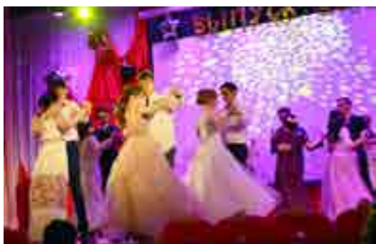
У выпускников последний школьный вальс