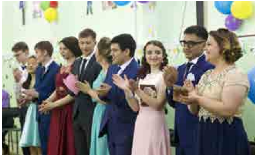
Газ-Са- линскую школу в этом году с хорошими результатами окончили 10 выпуск- ников

И вот наступает торжественный момент, которого выпускники ждали 11 лет - выдача аттестатов. Впереди их ждут ещё годы учёбы в разных учебных заведениях, но сегодня они получили свой первый документ об образовании.