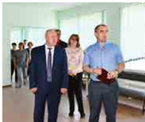
Представители районной власти проинспектировали подготовку образовательных учреждений Газ-Сале к новому учебному году

Газ-Сале стало третьим поселением в программе поездки временно исполняющего полномочия главы территории: на прошлой неделе Василий Паршаков побывал в Антипаюте, осмотрел Тазовский, до конца этой недели планирует посетить остальные сёла.