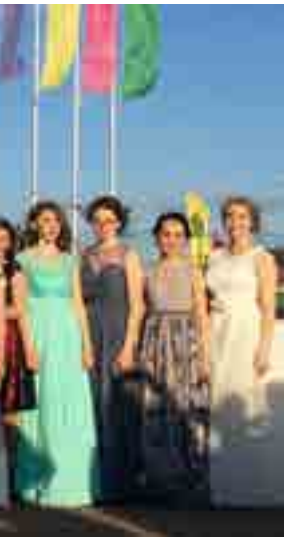
Гордость Тазовской средней школы - выпускни- ки-2018