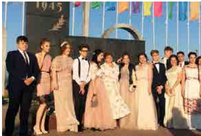
НАТАЛЬЯ АНИСИМОВА ФОТО АВТОРА

Праздник. В минувшую субботу 43 выпускника попрощались с Тазовской средней школой. Позади у этих ребят беззаботное детство, шумные перемены, невыученные уроки, сдача ЕГЭ. Завтра у них начнётся взрослая жизнь. А сегодня - выпускной вечер - один из самых красочных, тёплых праздников, который запомнится на всю жизнь