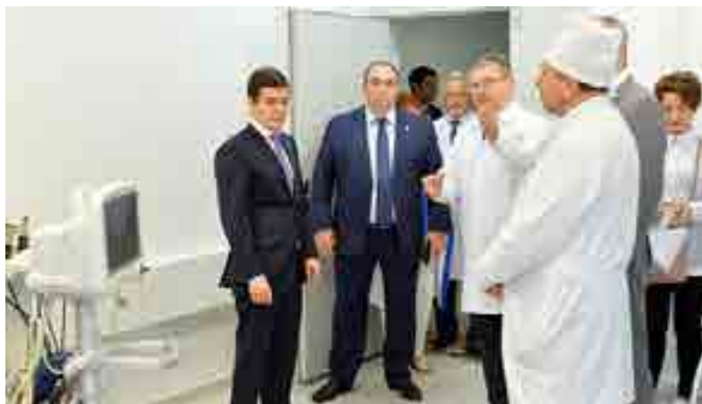
Региональный онкологический центр посетил врио губернатора Дмитрий Артюхов