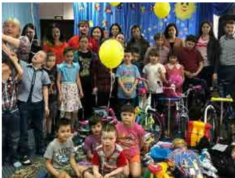
Спортивный инвентарь для воспитанников детского дома «Аистёнок»

В современном мире появилась новая валюта - благодарность. Для кого-то это может показаться абсурдом, но только не для волонтеров. Им не нужны деньги, чтобы совершать добрые поступки, им достаточно счастливых взглядов людей, которым они помогли