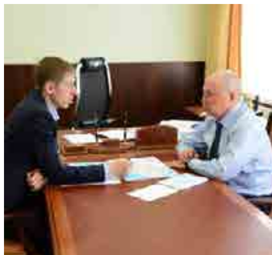
На встрече с главой села Гыда обсудили состояние дел, приоритетные направления работы

- Согласен, эта тема - одна из самых значимых в районе. Большую часть жизни я прожил на Ямале, поэтому как никто другой знаю, как важна здесь, в северных условиях, качественное и бесперебойное электро-, тепло-, водоснабжение. Главная проблема прежде всего в общетехническом износе отрасли. Своевременное обновление - это нагрузка, которая ложится на плечи ресурсоснабжающей организации, но она не должна отражаться в квитанциях потребителей. Оплата услуг должна соответствовать их качеству.