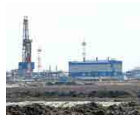
Запасы Тазовского месторождения составляют 438 млн тонн нефти и 186 млрд кубометров газа

- С июля, когда пройдёт основной пик паводка, мы начнём летние работы, которые продолжим до сентября-