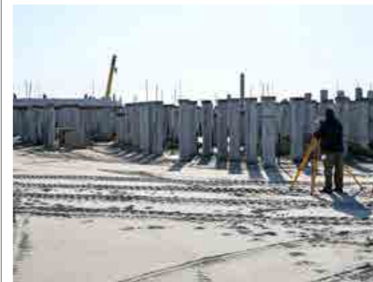
Специалисты Северной строительной компании занимаются возведением стен на одном из домов первой очереди микрорайона «Солнечный»