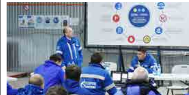
Главный принцип работы - не наносить вред людям, окружающей среде и имуществу

Впрочем, и до внедрения нового принципа вопросам безопасности производства в «Газпромнефть-Развитии» уделялось большое внимание. Соблюдение всех правил, инструкций, предписаний и документов, регламентирующих проведение работ, влияет на эффективность производства, утверждают специалисты предприятия. Но главное - конечно, это люди, их жизни и здоровье. «Каркас безопасности» призван сберечь сотрудников - главный актив компании. Барьеры, устанавливаемые в рамках проекта, автоматически распространяются и на подрядные организации, привлечённые к работе на Тазовском месторождении.