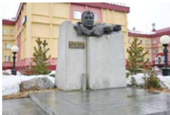
На УКПГ-2С установ- лен ме- мориал Андрею Бушаеву