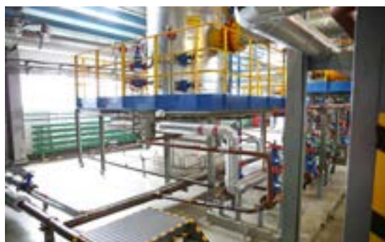
Цех по осушке га- за готовит топливо к транспор- тировке