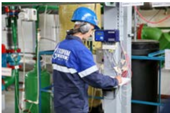
Участие человека в работе оборудо- вания - ми- нимально