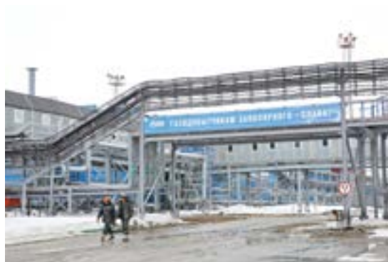
Всего на промысле в течение вахты тру- дятся 35- 40 человек