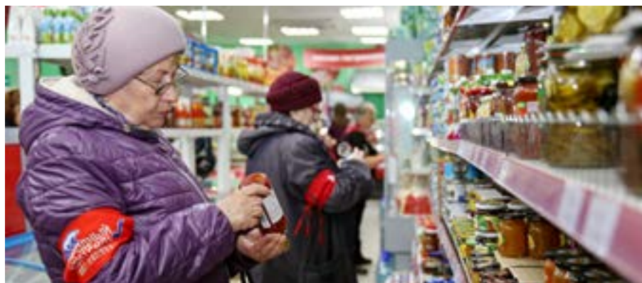
Народные контролёры за работой

В любом случае, как бы не было сложно проверить все товары, торговать просроченными продуктами, как минимум, не престижно. Может, если не получается из года в год справиться с нарушениями, стоит тогда хотя бы поменять название магазина?