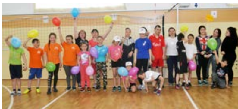
В Тазовской спортивной школе прошли соревнования среди замещающих семей