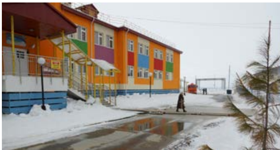
С 18 июня в детском саду «Радуга» начнут проводить ремонтные работы