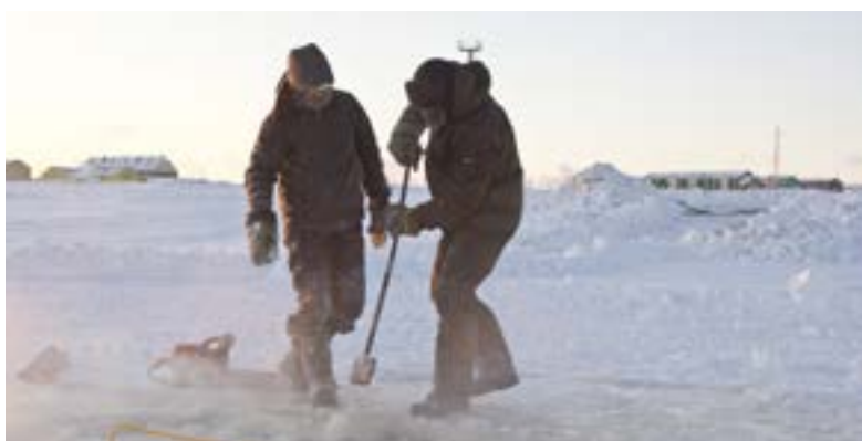
Купель традиционно будет располагаться на реке Таз, чуть выше места проведения Слёта оленеводов

Добавим, что традиционно на льду реки Таз, чуть выше того места, где обычно проходит Слёт оленеводов, в Крещенскую ночь будут дежурить представители экстренных служб, спасатели и казаки.