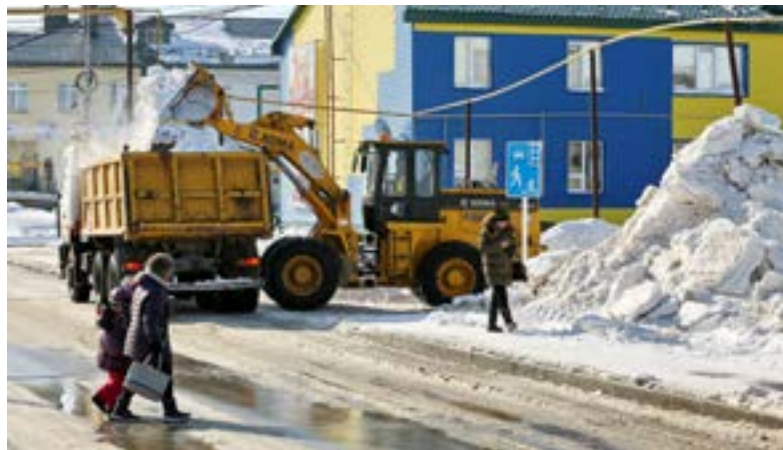
Сотрудники ТМУДТП занимаются вывозом снега с улиц райцентра