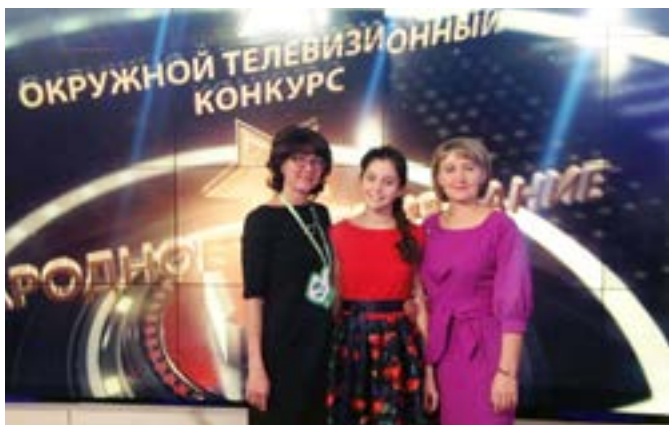
Тазовская детская школа искусств стала победителем X Окружного телевизионного конкурса «Народное признание», проводимого Первым Арктическим телеканалом, и получила Диплом и Звезду победителя