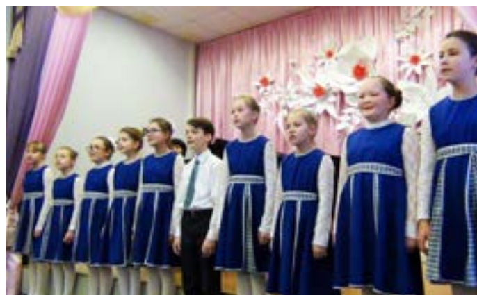
Вокальный ансамбль «Капельки» получил звание лауреата II степени VIII окружного конкурса детского и юношеского творчества «Новые имена» в Новом Уренгое