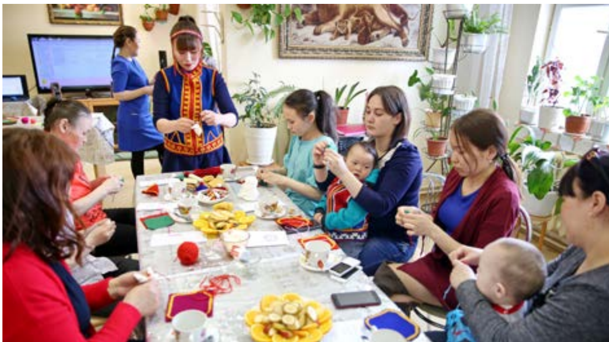
Накануне Международного дня семьи подопечные центра «Забота» научились мастерить кукол