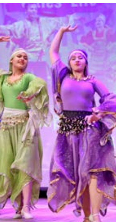
Ансамбль народно-сценического танца «Радуга» стал дипломантом VIII окружного фестиваля танца «Кудесы» в Новом Уренгое, а также получил звание лауреата I степени Международного фестиваля-конкурса «Планета искусств» в Алуште