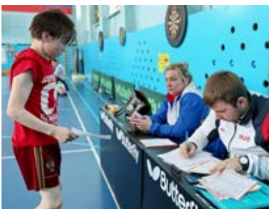
Судьи фиксируют результаты участников спортивного фестиваля