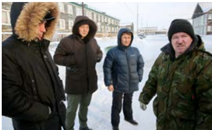
Жители микрорайона Геолог жалуются депутатам на затопление дороги

Председатель Собрании депутатов напоминает, что народные избранники являются представителями населения посёлка, и их деятельность направлена на то, чтобы жизнь людей становилась лучше и комфортнее.