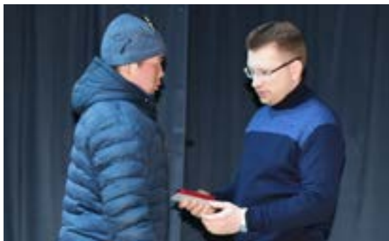
Глава района вручил медали «За верность Северу»