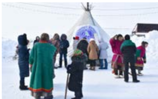
Каждый день в чум заходили по 300 гостей

численности оленпоголовья, сохранить которую как раз и помогут ветеринарные мероприятия.