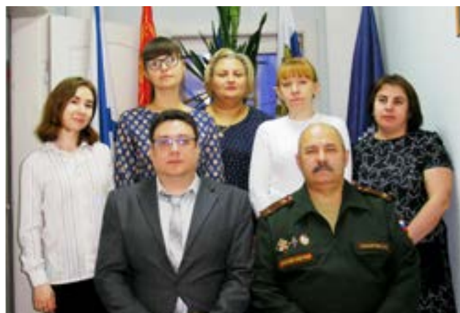
Коллектив военного комиссариата в настоящее время