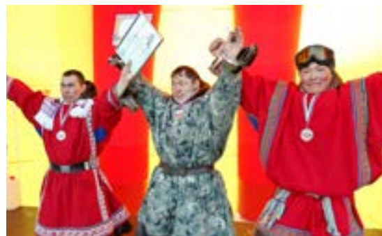
Тройка призёров гонок на оленьих упряжках среди мужчин

ванным участникам - 80 человек - гонки среди мужчин всё равно не обошли метание тынзына, но если объединить женские и мужские гонки да ещё и прибавить четвероногих участников, то в сумме получится несколько сотен.