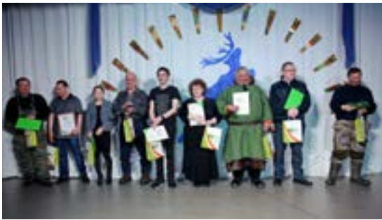
В торжественной обстановке вручили награды передовым работникам АПК