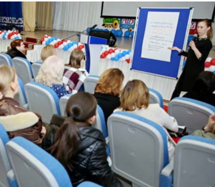
Спикеры групп презентовали планы мероприятий для участия в эстафете «Родители Ямала против ВИЧ»