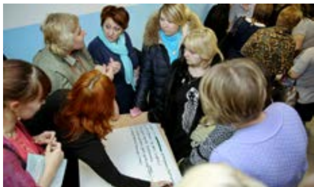
Мозговой штурм: родители обсуждают проблему и ищут пути решения