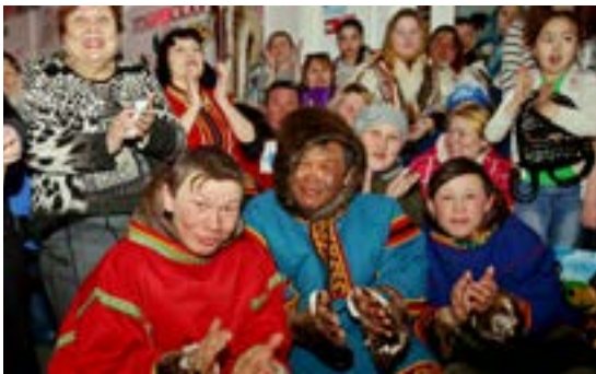
Зал антипаютинского Дома культуры был полон зрителей

чены сертификаты на снегоходы, предоставленные ООО «Газпром добыча Ямбург».