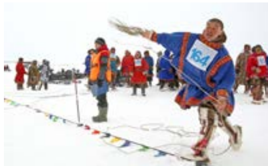
На соревнованиях по метанию тынзына зарегистрировалось больше всего участников