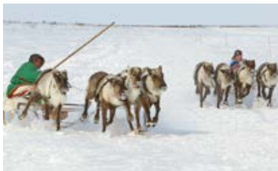
Финиширование двух упряжек с минимальным разрывом - редкость