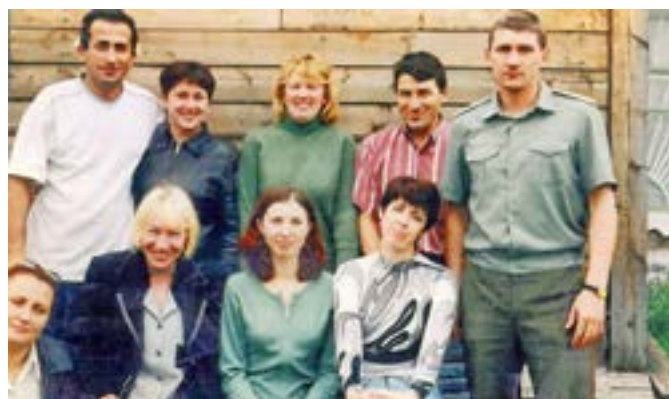
Коллектив военкомата. 2002 год

С 1 января 2010 года военный комиссариат Тазовского района был реорганизован