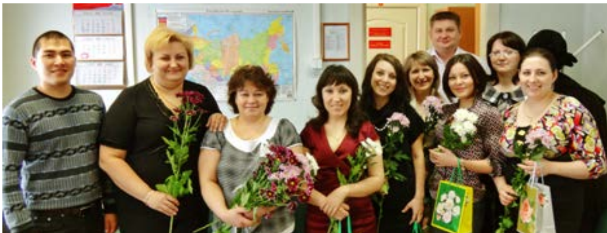
Коллектив военного комис- сариата Тазовского района. Апрель 2012 года