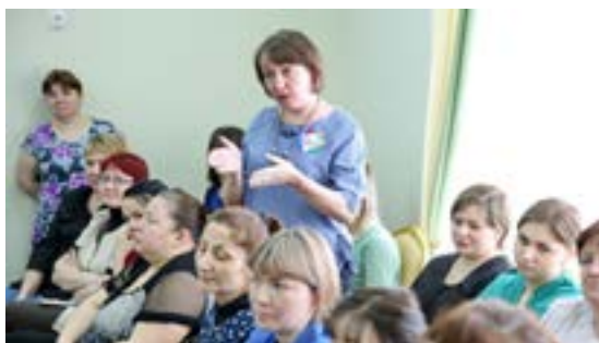
Заведующий детским садом «Радуга» задала Главе района немало вопросов