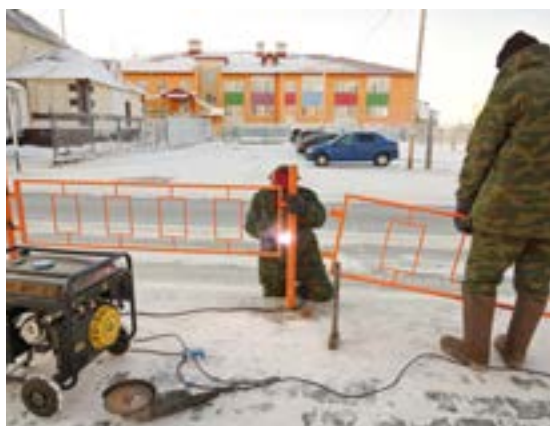
Уже в среду, 14 марта, в Тазовском у детского сада «Радуга» был сделан пешеходный переход и установлены соответствующие дорожные знаки