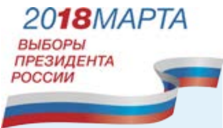
График работы Территориальной избирательной комиссии Тазовского района по приёму заявлений о включении избирателей в список избирателей по месту нахождения на выборах Президента Российской Федерации 18 марта 2018 года

в период с 31 января по 12 марта 2018 года: