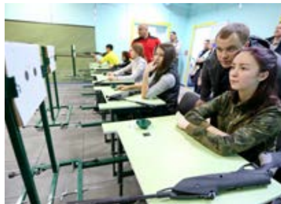
Стрелки из ГСШ не порадовали своего преподавателя