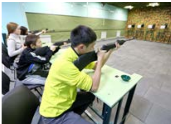
Расстояние до мишеней в тире составляет 10 метров