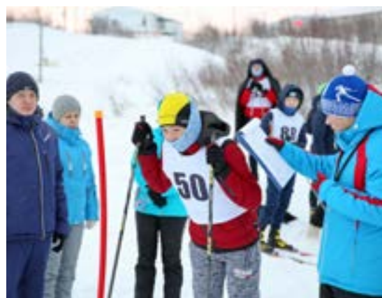
На лыжную трассу вышли в основном школьники

В течение учебного года мы готовились, стреляли, сдавали другие нормы комплекса ГТО.