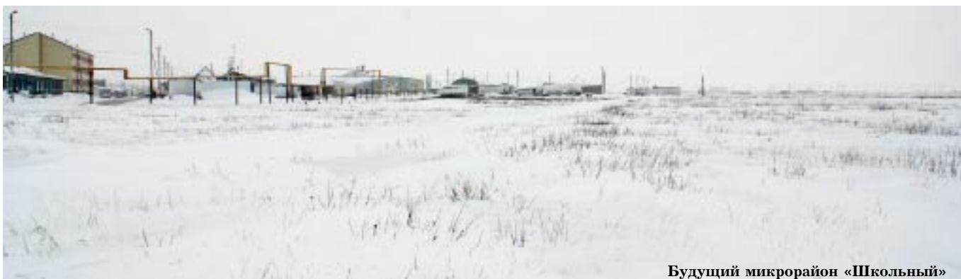
Будущий микрорайон «Школьный»

Добавим, многодетные семьи пользуются льготами в получении земельного участка под индивидуальный дом – им участок передается на безвозмездной основе. По положению многодетным семьям предоставляется до