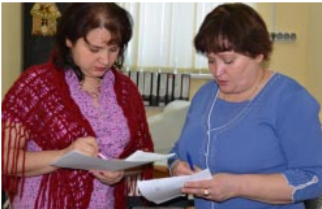
В график репетиций вносятся корректировки