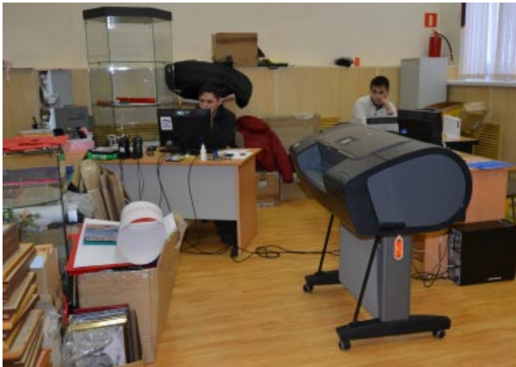
Рабочий кабинет сотрудников ЦКиД

людьми попросту негде заниматься. Сразу выпали занятия в кружках хореографии, аэробики, декоративно-прикладного творчества. Все они проходили в хореографическом зале, где сейчас разместились работники ЦКиД. " У нас специалист занимается декоративно-прикладным творчеством со взрослыми в социальном доме. Занятия с детьми - она договаривается и проводит в школе-интернате. Несёт туда свои сумки с шитьём и всем прочим", - рас-