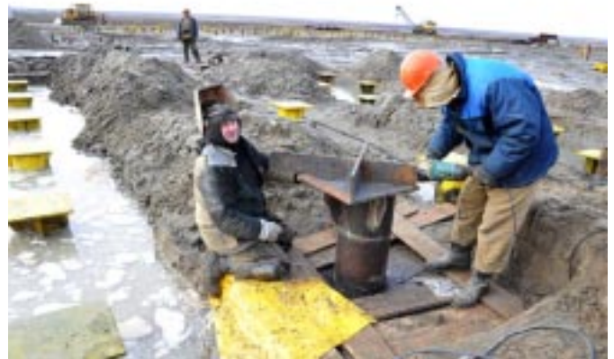
Освоение месторождений Большехетской впадины

Поисково-разведочное бурение до глубины 500 метров осложнено многолетнемерзлыми толщами, которые провоцируют образование гидратных пробок при испытании газоносных пластов. А начиная с 3500 метров и глубже - осложнено зонами аномально высокого пластового давления (АВПД), коэффициент аномальности которых более чем в два раза превышает гидростатическое давление. В связи с чем необходимо применять высокотехнологичное оборудование и материалы для бурения сверхглубоких скважин, осложненных АВПД.