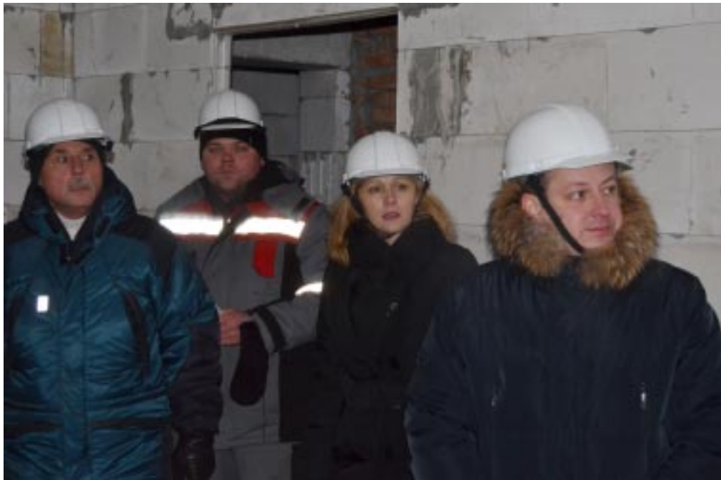
На строительстве жилого дома по улице Геофизиков

Об этом и разговор с главой поселка Тазовский Вадимом ЧЕТВЕРТКОВЫМ.