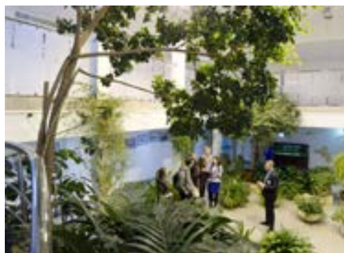
В зимнем саду представлено около 80 видов субтропических растений