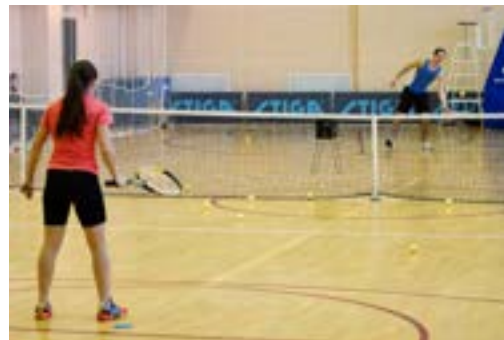
Лыжная трасса, бильярд, теннис, тренажёры - для любого возраста можно найти занятие