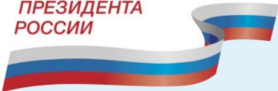
График работы Территориальной избирательной комиссии Тазовского района по приёму заявлений о включении избирателей в список избирателей по месту нахождения на выборах Президента Российской Федерации 18 марта 2018 года

в период с 31 января по 12 марта 2018 года: в рабочие дни с 10.00 до 12.30, с 14.00 до 19.00, в выходные и праздничные дни с 11.00 до 15.00.