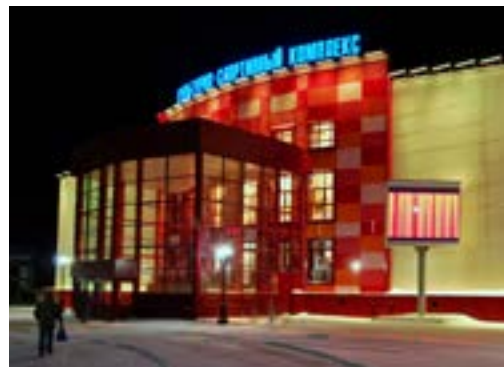
В КСК проходят и культурные мероприятия - концерты, игры КВН, показ фильмов