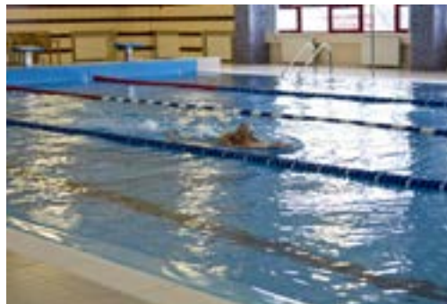
Работники Заполярного НГКМ успевают в обеденный перерыв заглянуть в бассейн

Услугами КСК все работники Заполярного НГКМ пользуются бесплатно. За день здесь фиксируют порядка 200 посещений, в год - 70 тысяч