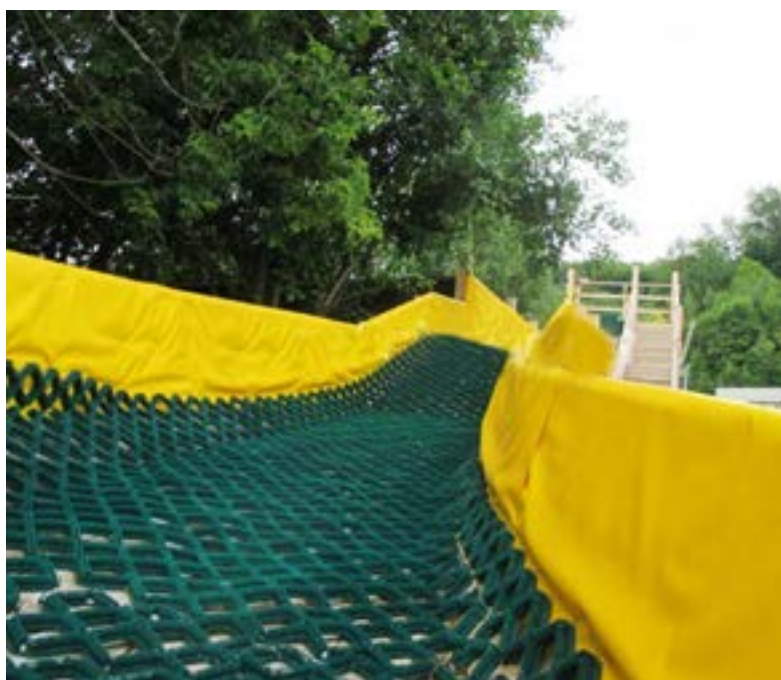
Горка для всевозможного катания на тюбингах

Благоустройство. Мы продолжаем цикл материалов о том, как в поселениях района реализуют программу по формированию комфортной городской среды. В предыдущих номерах мы рассказали о проектах Тазовского и Антипаюты, Газ-Сале и Находки, предложенных для голосования на портале «Живём на Севере» и планируемых к воплощению в жизнь уже в 2019 году. Сегодня - рассказ о проектах по благоустройству села Гыда, самого северного поселения района