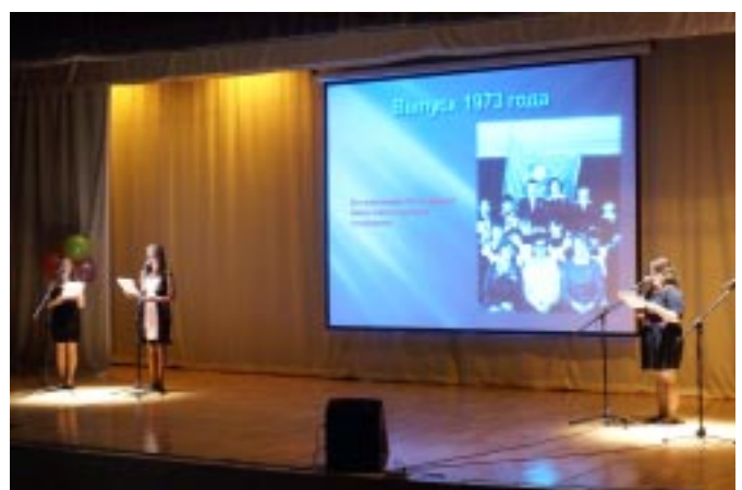
Ученицы ТСПШ рассказывают о выпускниках 1973 года

Выставки и стенды школьного музея в этот день, действительно, радовали посетителей. На