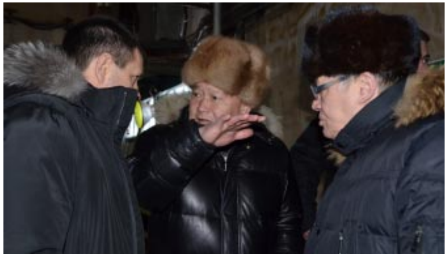
Разговор в котельной села Газ-Сале

Встреча с избирателями в Тазовском, состоявшаяся в субботу во второй половине дня, не отличалась такой активностью участников, как в Газ-Сале. В школе-интернате собрались педагоги и старшеклассники образовательного учреждения. В адрес депутата Государственной Думы ими было задано всего два вопроса и оба касались тру-