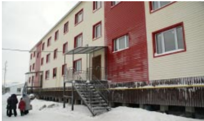
Ипотечный дом по ул. Калинина, 19