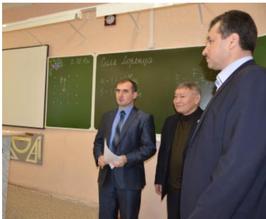
В учебном классе Газ-Салинской средней школы

"Я уверен, на Ямале и через 30, и через 50 лет оленеводство будет. Я как депутат приложу к этому все усилия. В нашем регионе для сохранения уникального национального колорита, национальных промыслов, делается немало. Губернатором Ямала, окружным Законодательным Собранием принято много законов, касающихся поддержки кочующего населения. Нам повезло, что у руля многих уровней ямальской власти стоят люди, выросшие на этой территории, знающие специфику региона.