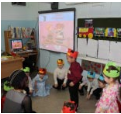
Путешествие на поезде

предложено было подумать, какие нужно сделать баки и урны, чтобы люди захотели выбросить туда мусор? Дети предлагали и с национальным орнаментом, и с цветочками - красивые, разрисованные. В завершение занятия каждый ребенок говорил свое пожелание нашему поселку и жителям: "Я очень хочу, чтобы наш поселок стал чище", "Чтобы люди не бросали мусор на улице", "Чтобы наш поселок стал красивее и лучше".